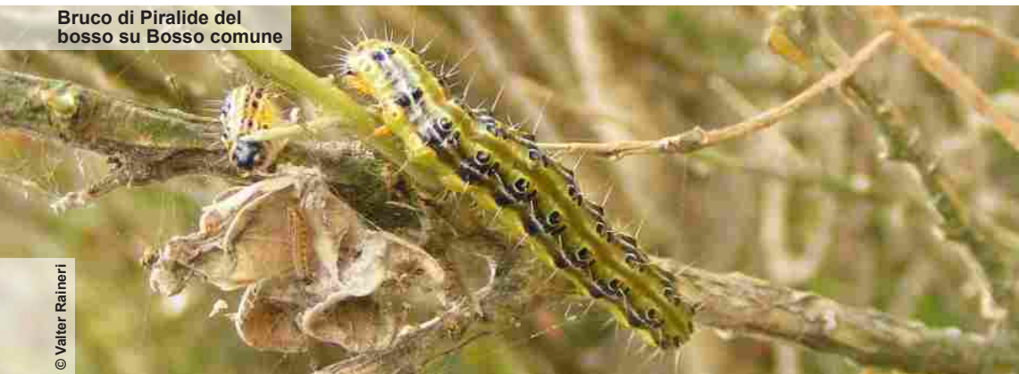
Bruco di Piralide del bosso su Bosso comune

La lista dinamica delle specie aliene sottoposte a tali restrizioni (pp. 14-15), pubblicata nel luglio 2017, verrà aggiornata con l'aggiunta di altre entità. Tali specie saranno inserite nella lista transfrontaliera delle specie pericolose per la biodiversità .